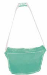
Bolsillo del revés cuando se pliega la chaqueta (sistema K-Way®)